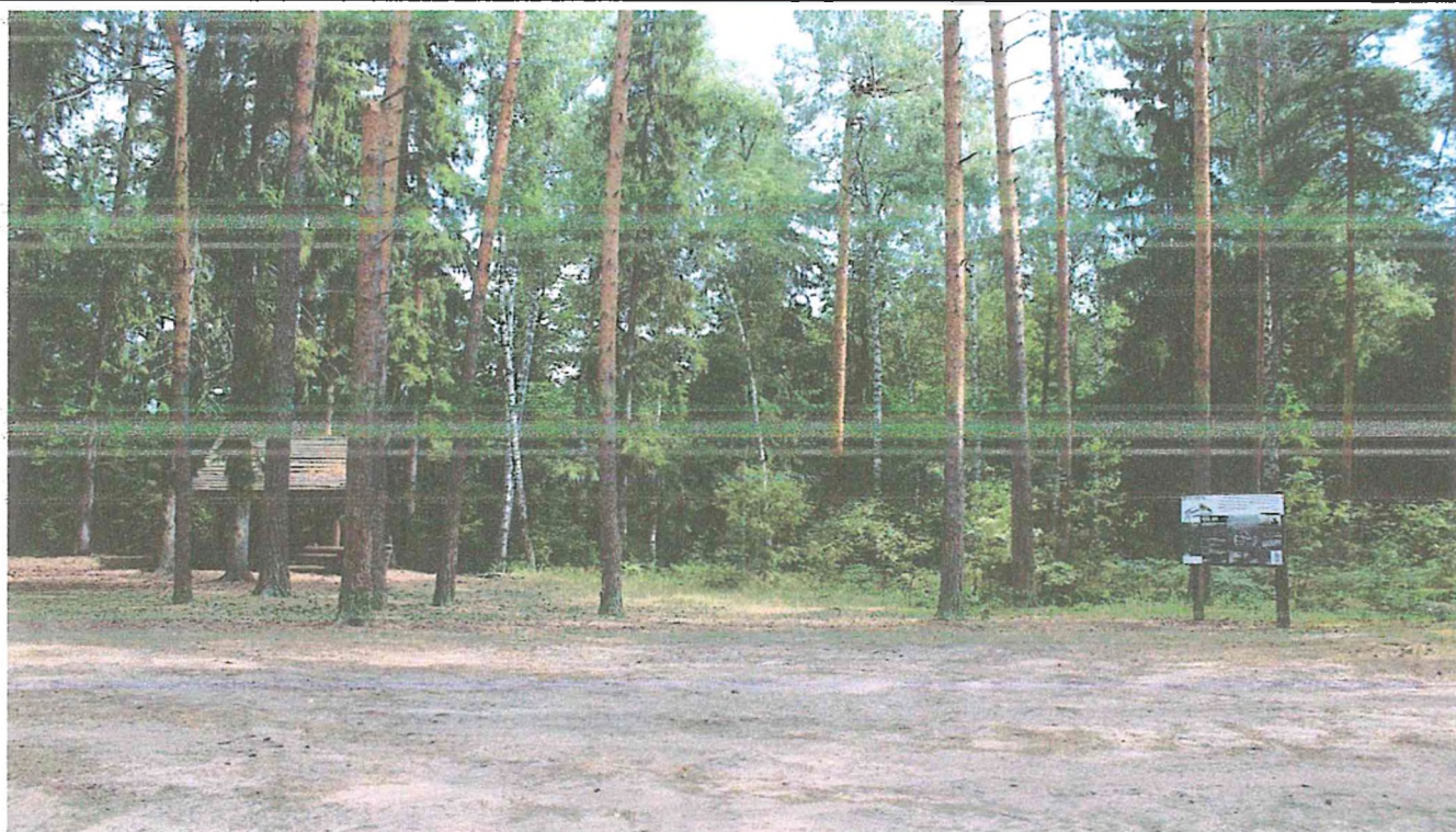
4. Место отдыха на озере Шуя.