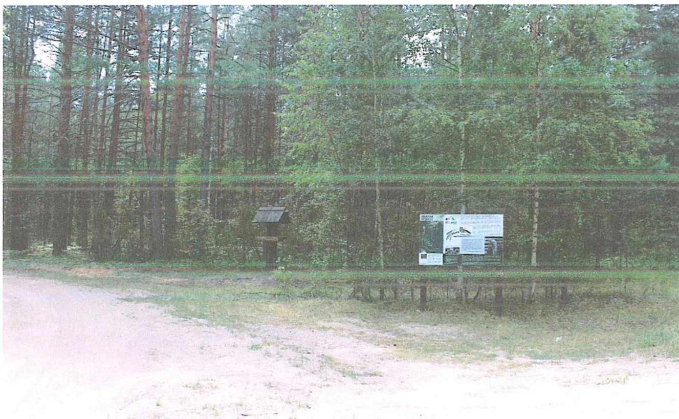
2. Поворот на кордон 273.