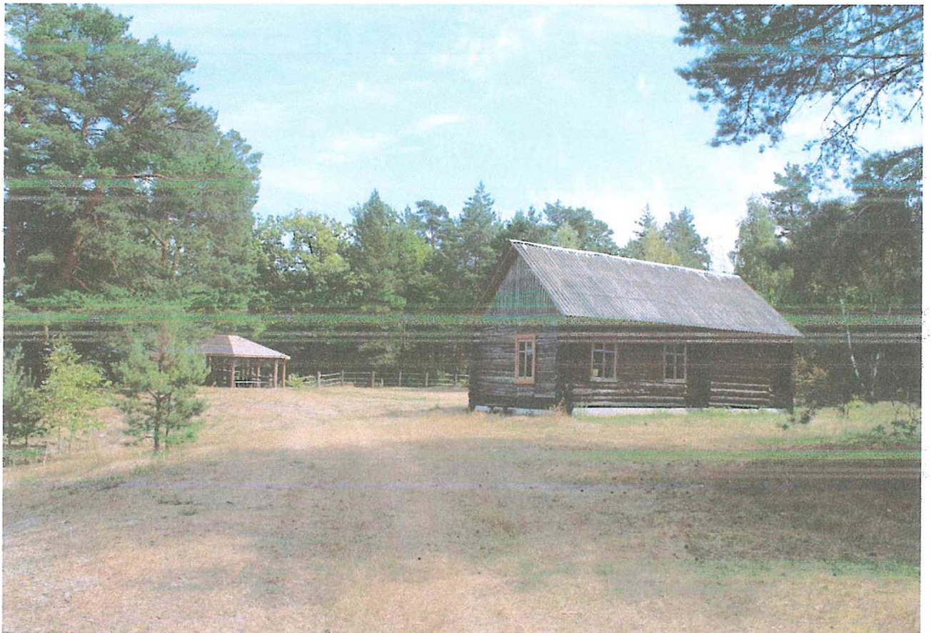
6. Кордон 273.