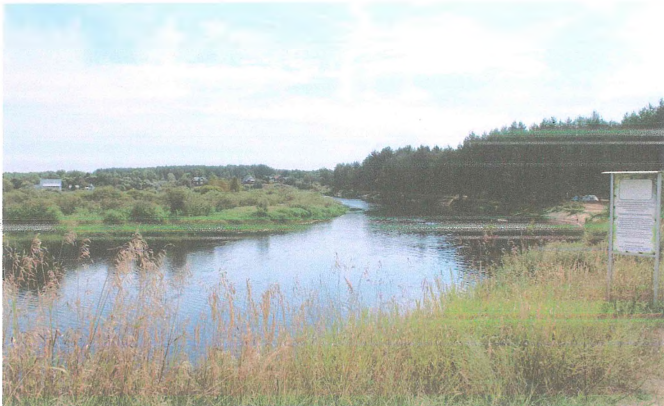
1. Фото реки Пра.