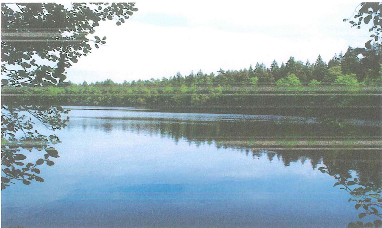
3. Озеро Шуя.