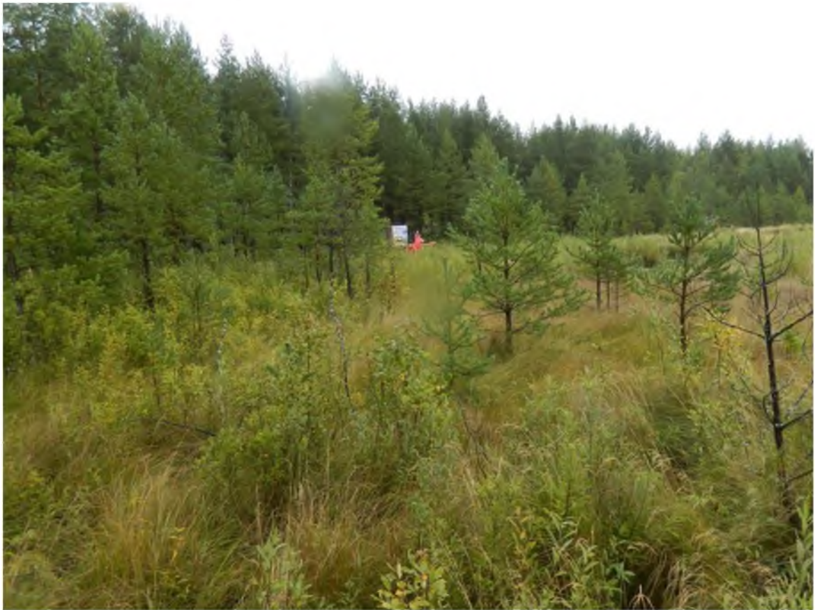
2. Смотровая площадка №3 – Вид на Сергеево болото