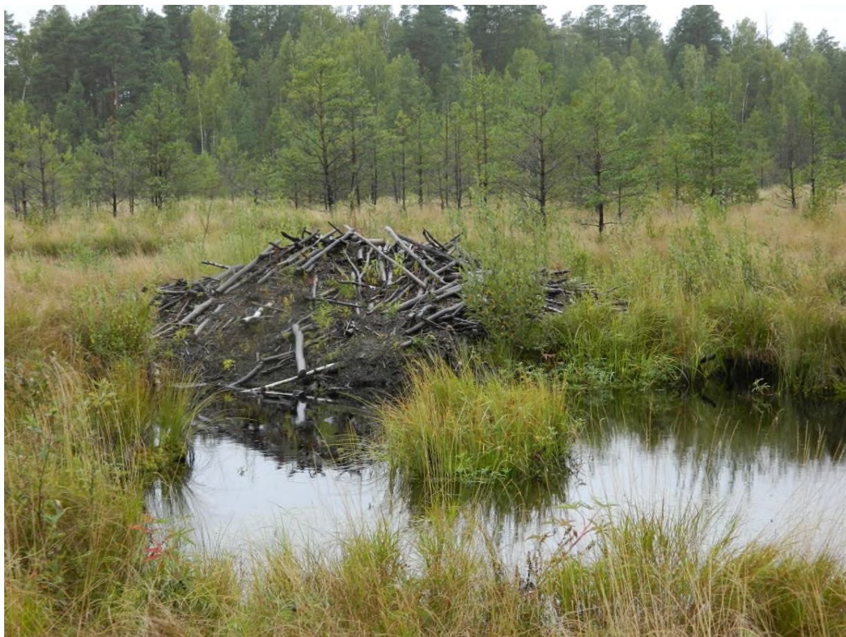
1. Смотровая площадка №1 - Бобровая хатка