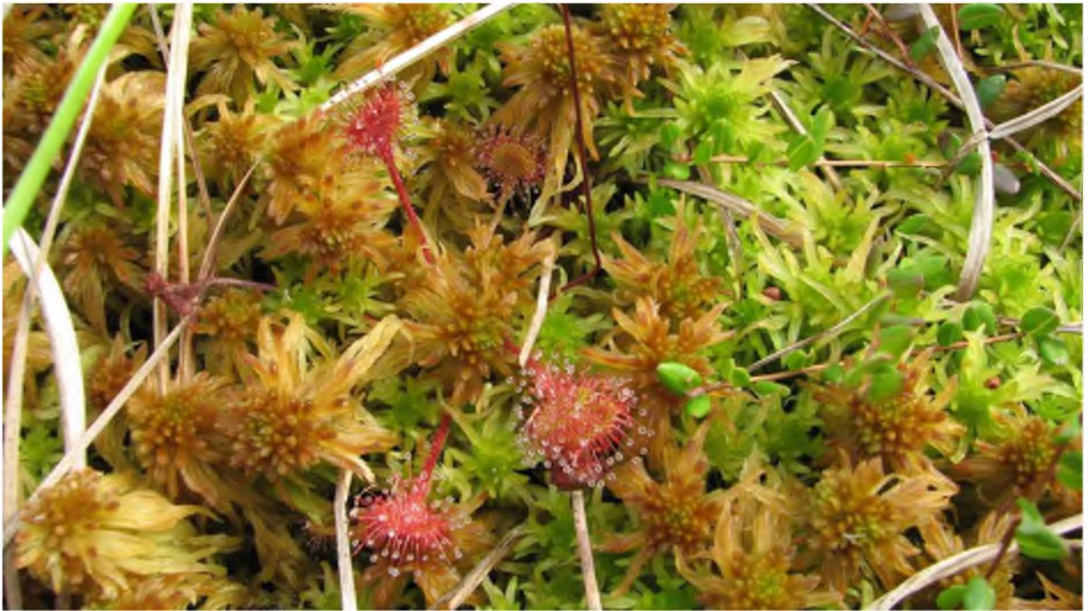
4. Рослянка круглолистная