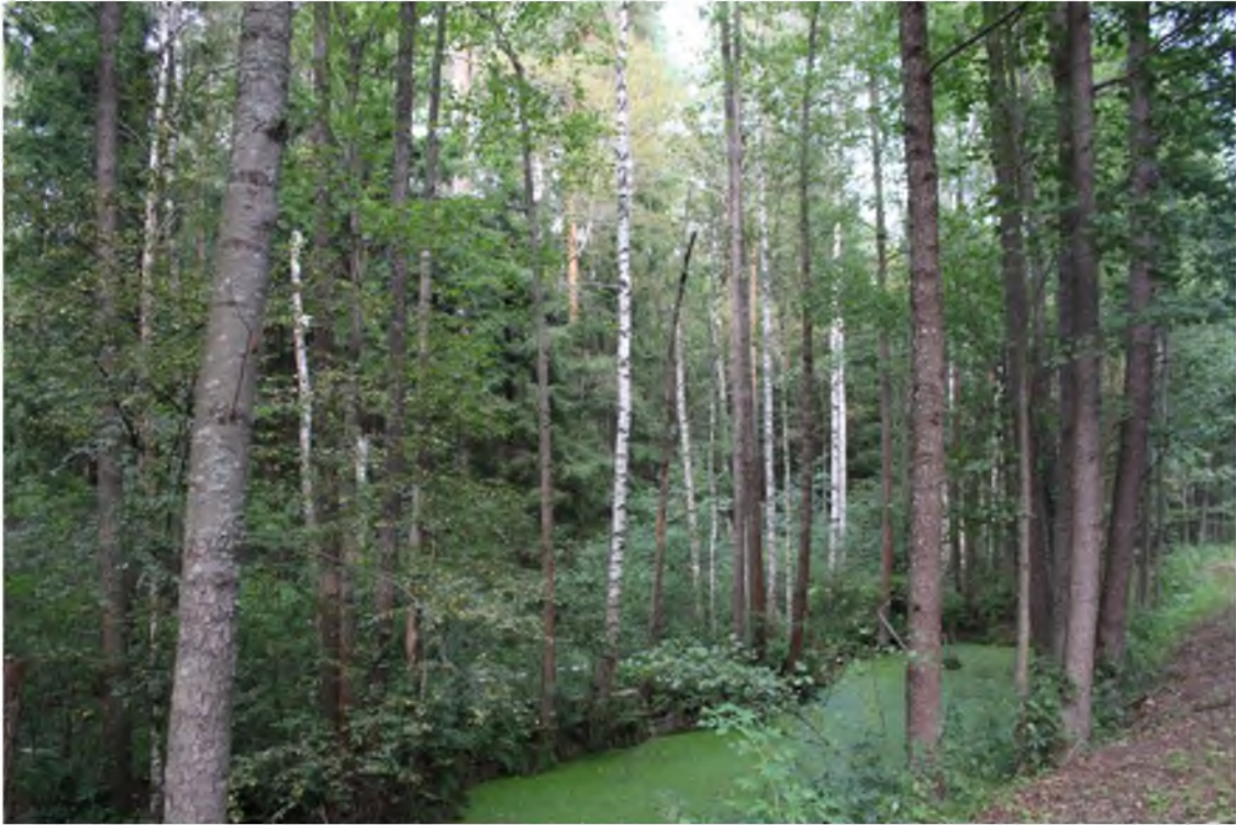
6. Черноольшанник