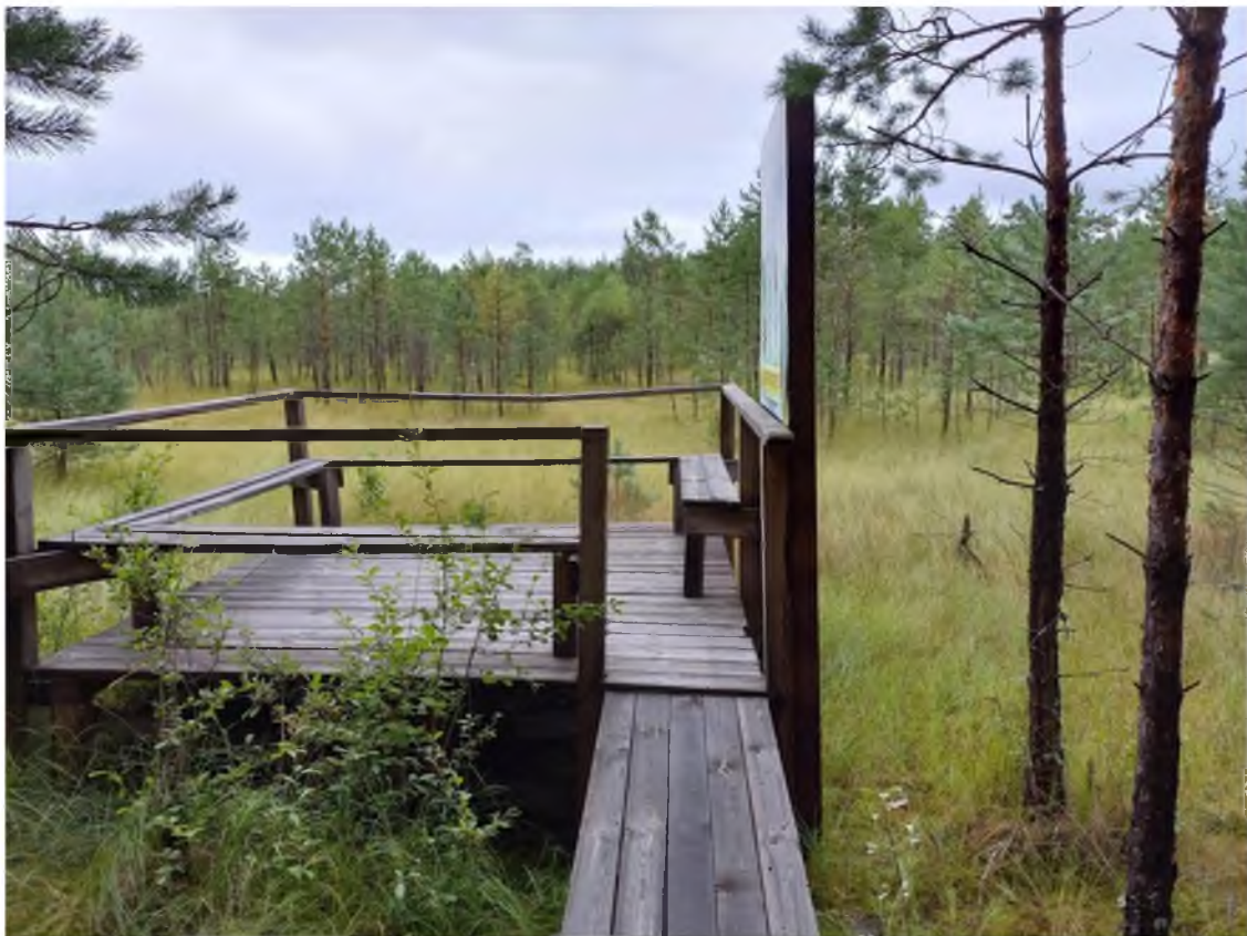
3. Смотровая площадка №3