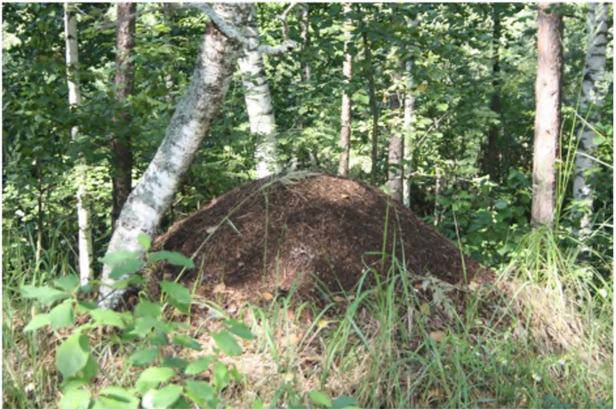
5. Муравейник, автор фото З. Дроздова