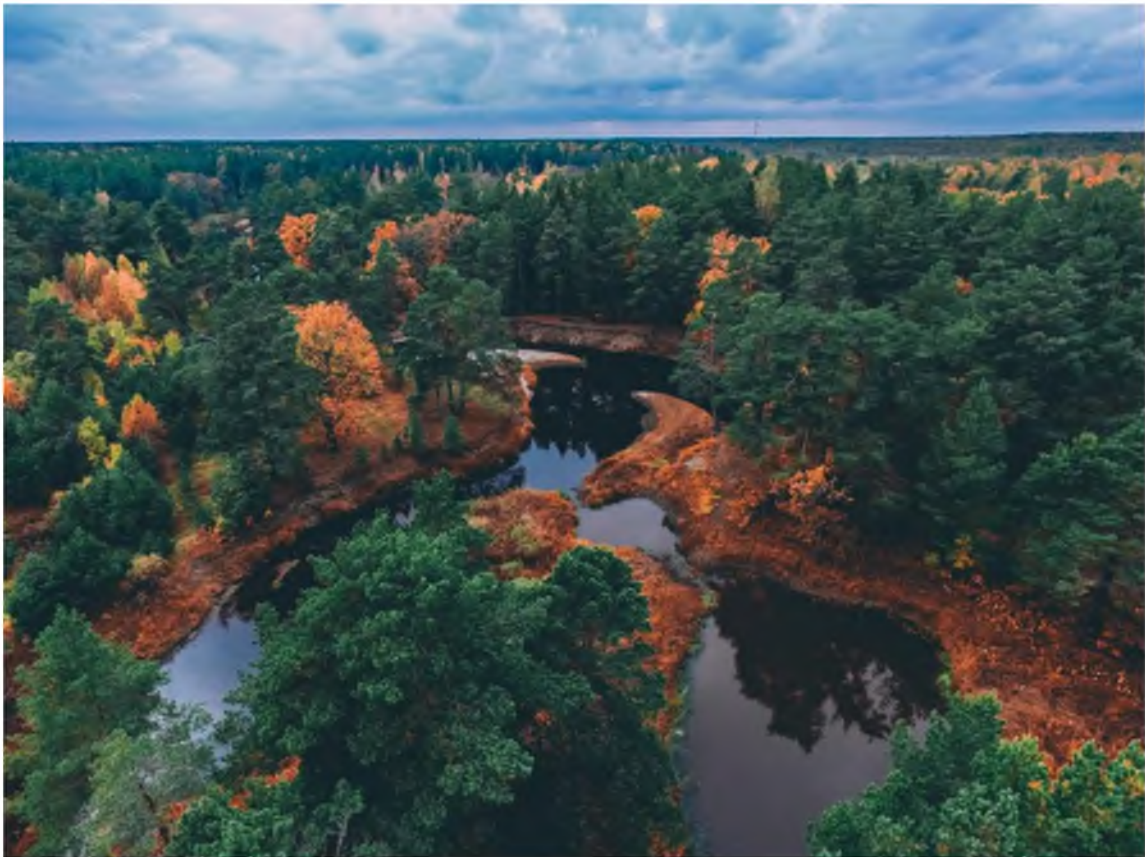
7. Слияние рек Польша и Бужа