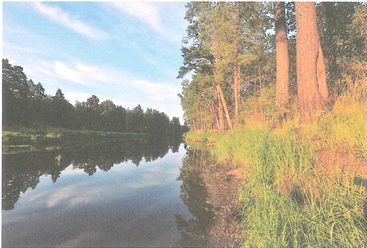
6. Заводь реки Пры на экологической тропе «У заводи».