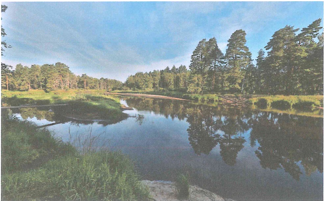
2. Заводь у кордона, впадение в Пру.