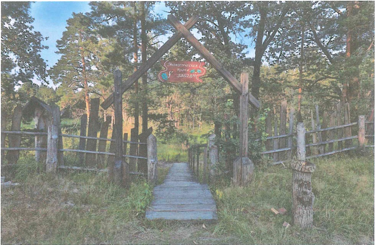
1. Начало экотропы.