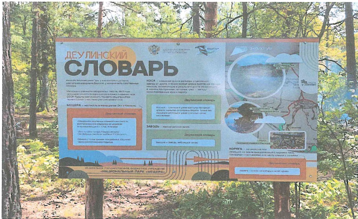
5. Информационный стенд «Деулинский словарь».