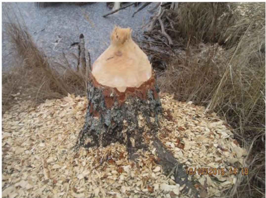
6. Погрызы бобров.