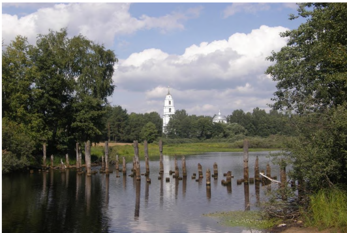
1. Старинный Рязанский тракт.