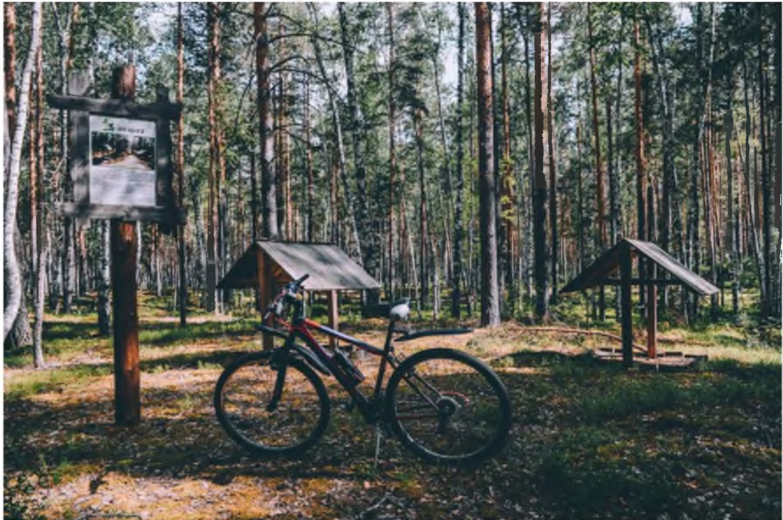
5. Галечник и порхалище.