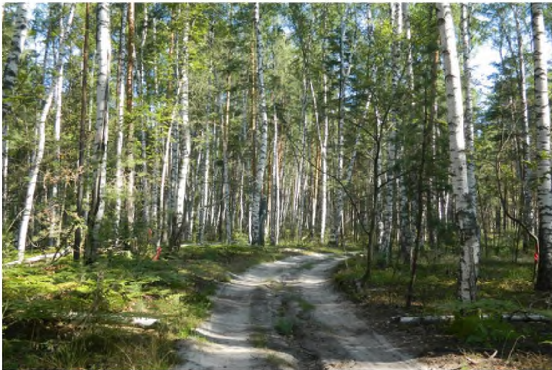
3. Березовая роща.