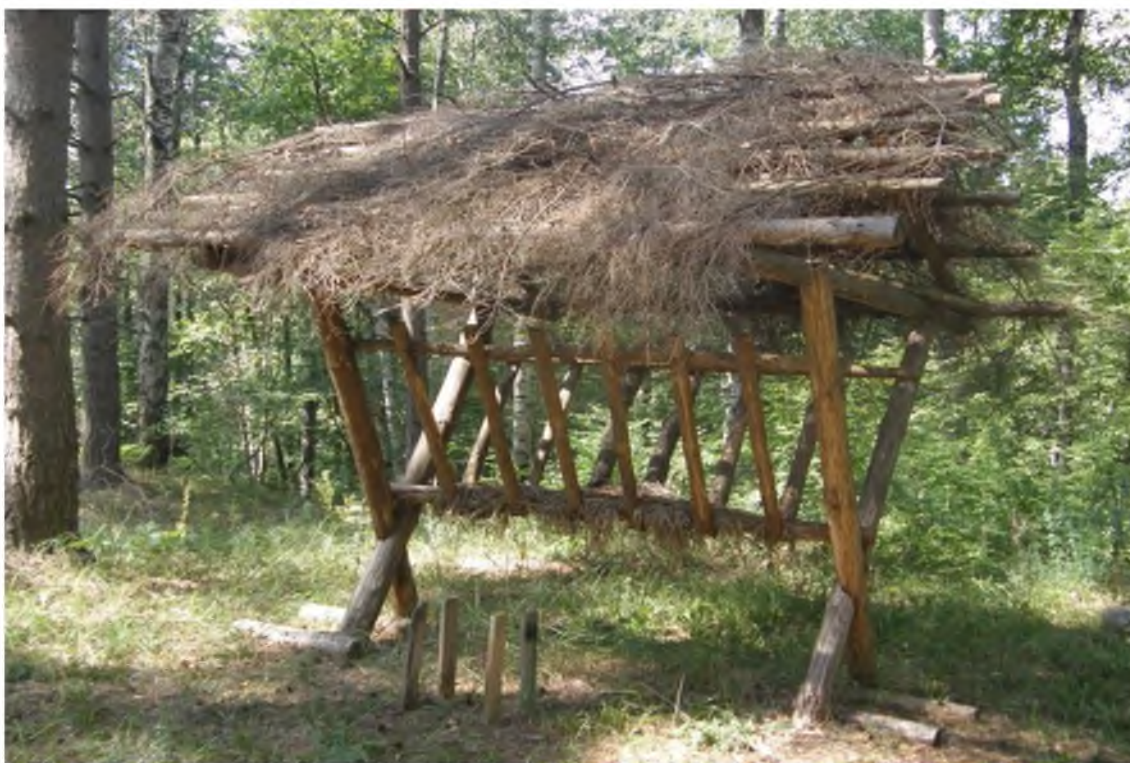
4. Ясли.