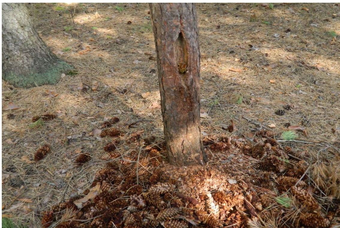
2. Кузница дятла.