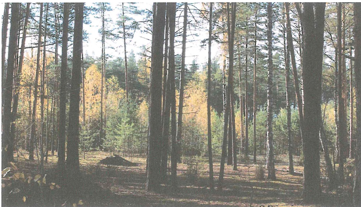
2. Лес на тропе.