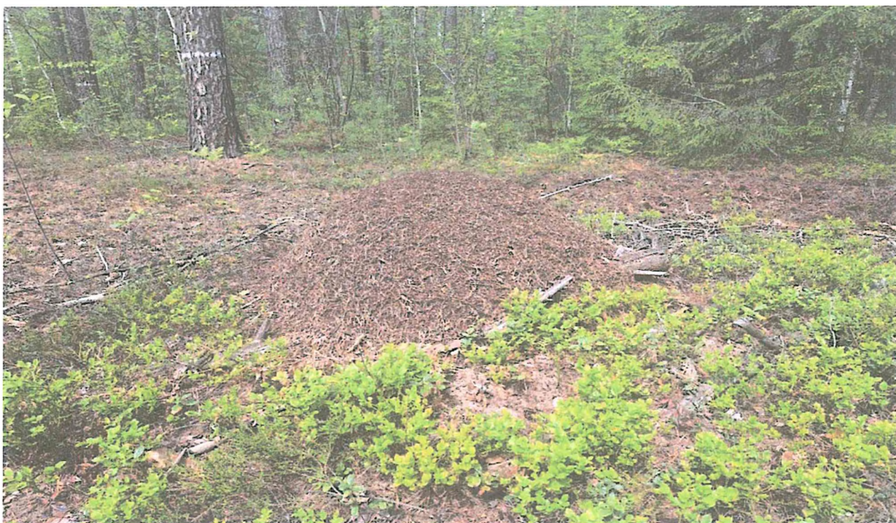
1. Муравейник.