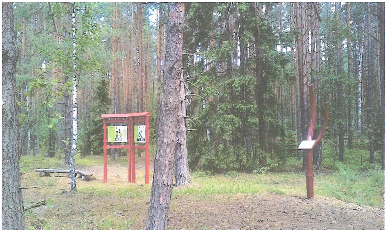
4. Информационный стенд «Птицы».