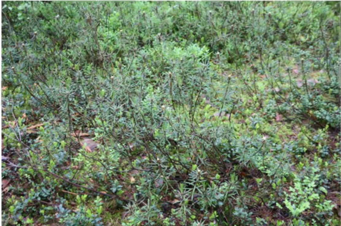
5. Заболоченный сфагновый лес на тропе