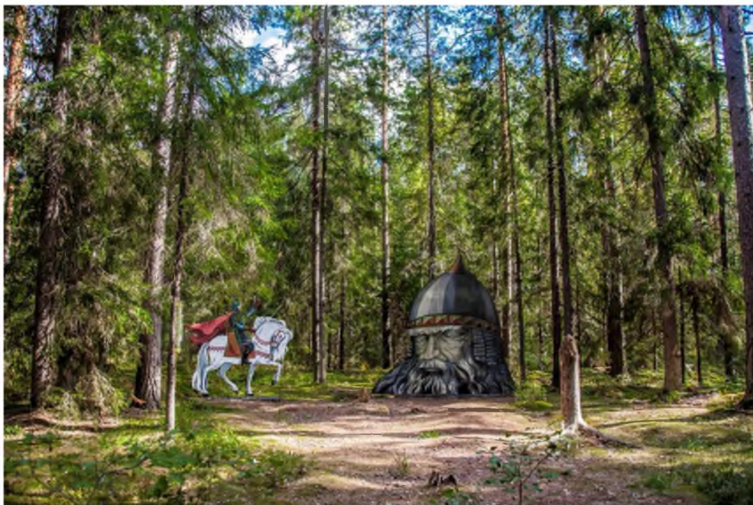
7. Тропа сказок, сказка А. Пушкина «Руслан и Людмила», автор З. Дроздова