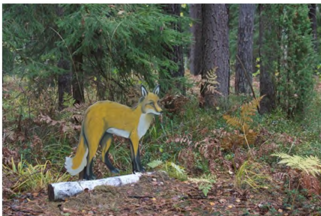
4. Фигурка лисицы на тропе