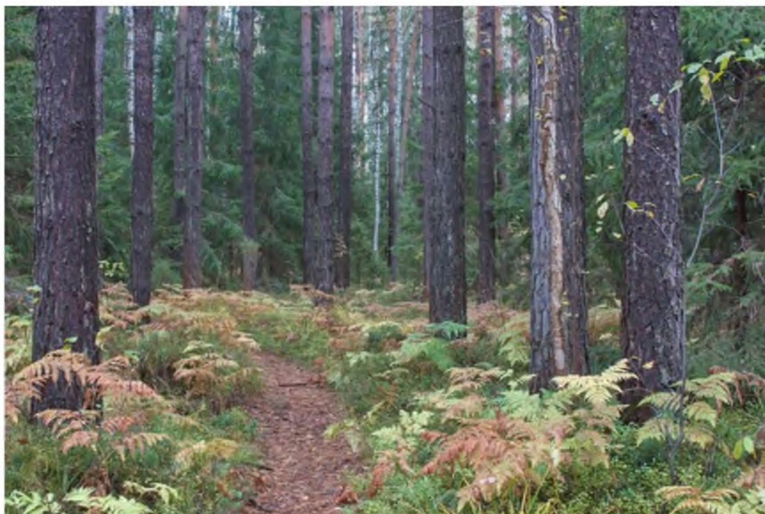
3. Сосняк-черничник на тропе