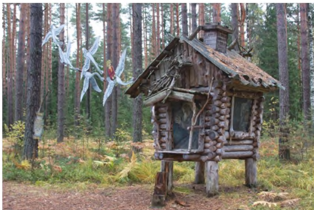
8. Тропа сказок, сказка гуси-лебеди