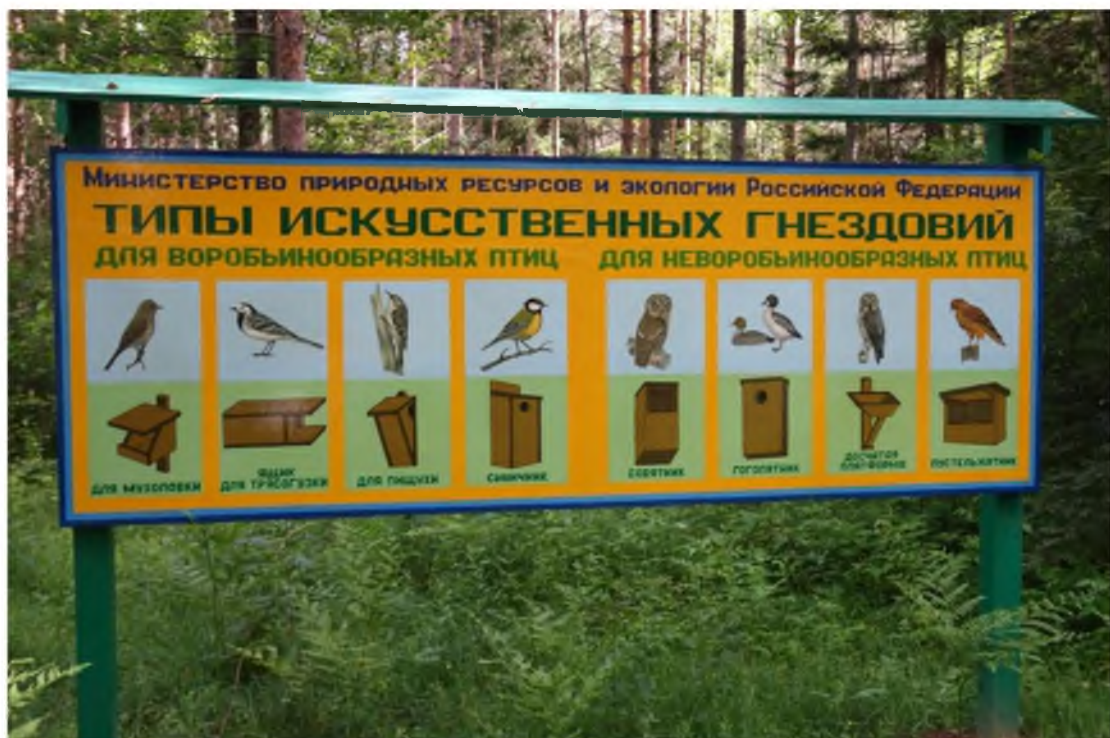
6. Информационный стенд на тропе