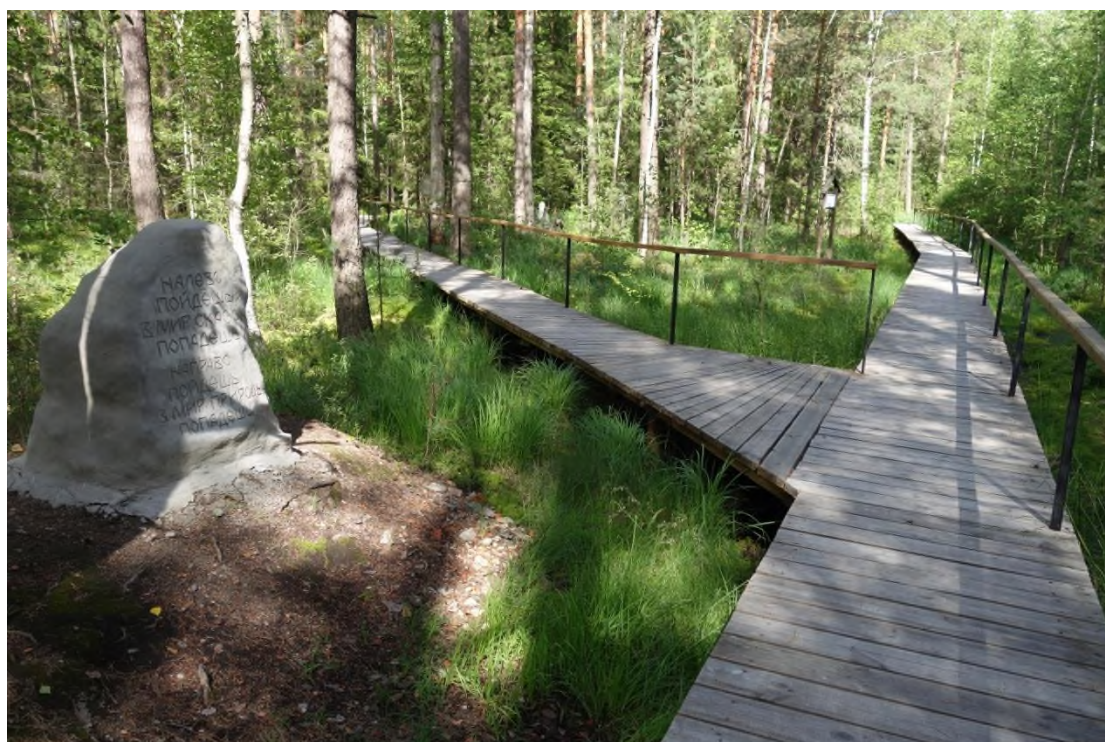
2. Камень-указатель на тропе